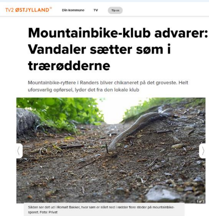
Oplevede gener i naturen